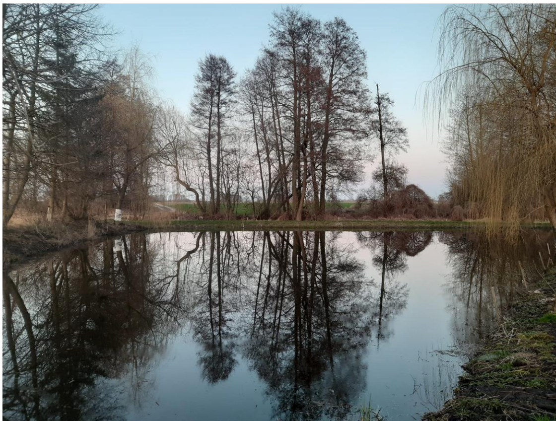
Początek wiosny na Mazowszu, 07.03.2024 r.