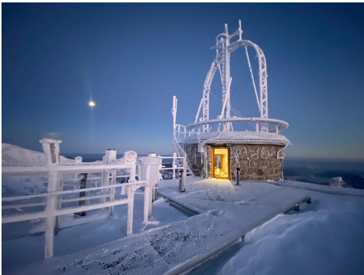
Zima na Kasprowym Wierchu

Uwaga! W niedzielę w centrum i na południu kraju intensywne opady śniegu nawet do 20 cm. Możliwe są również zawieje i zamiecie śnieżne. Z kolei na południowym wschodzie opady marnzące powodujące gołoledź, a więc ślisko! Po weekendzie widać wyraźne ochłodzenie.