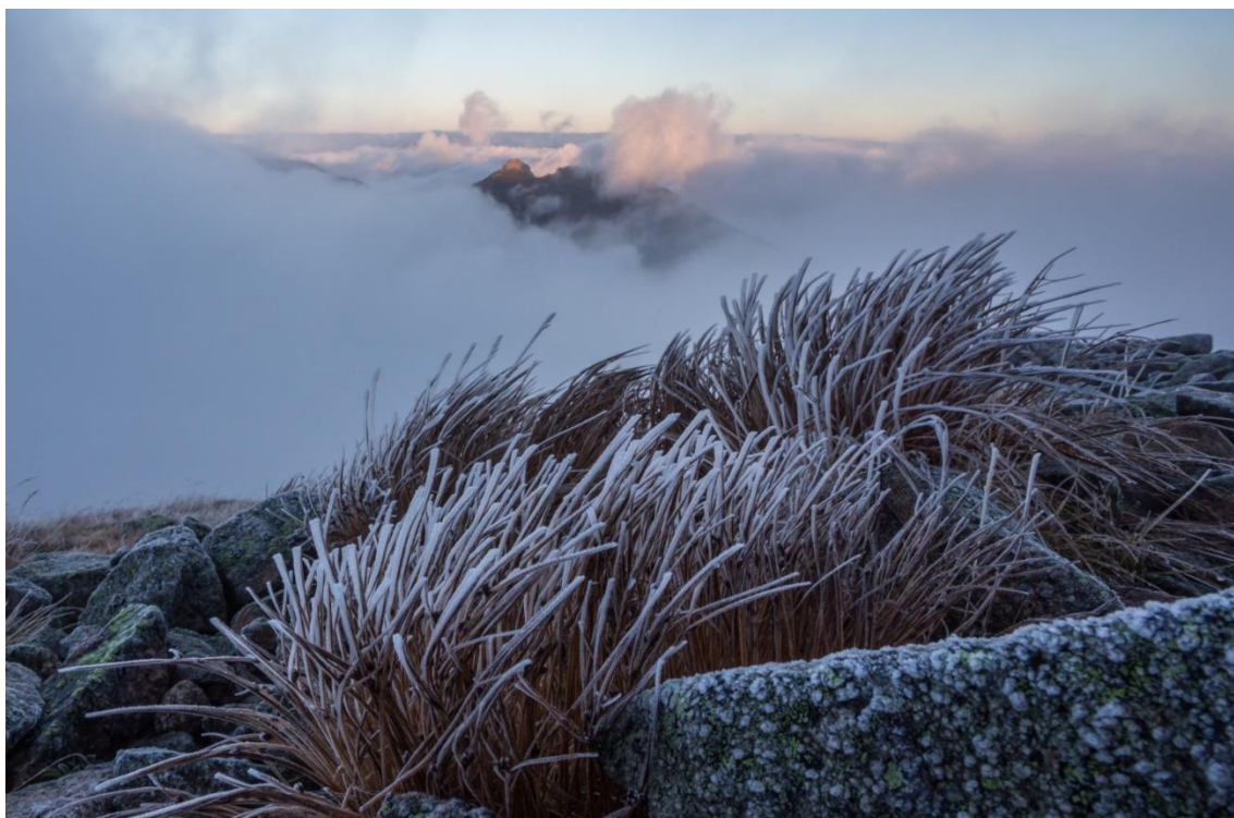
Zima wysoko w Tatrach.

Kraków 2°C Kielce 1°C Rzeszów 3°C Zakopane 1°C