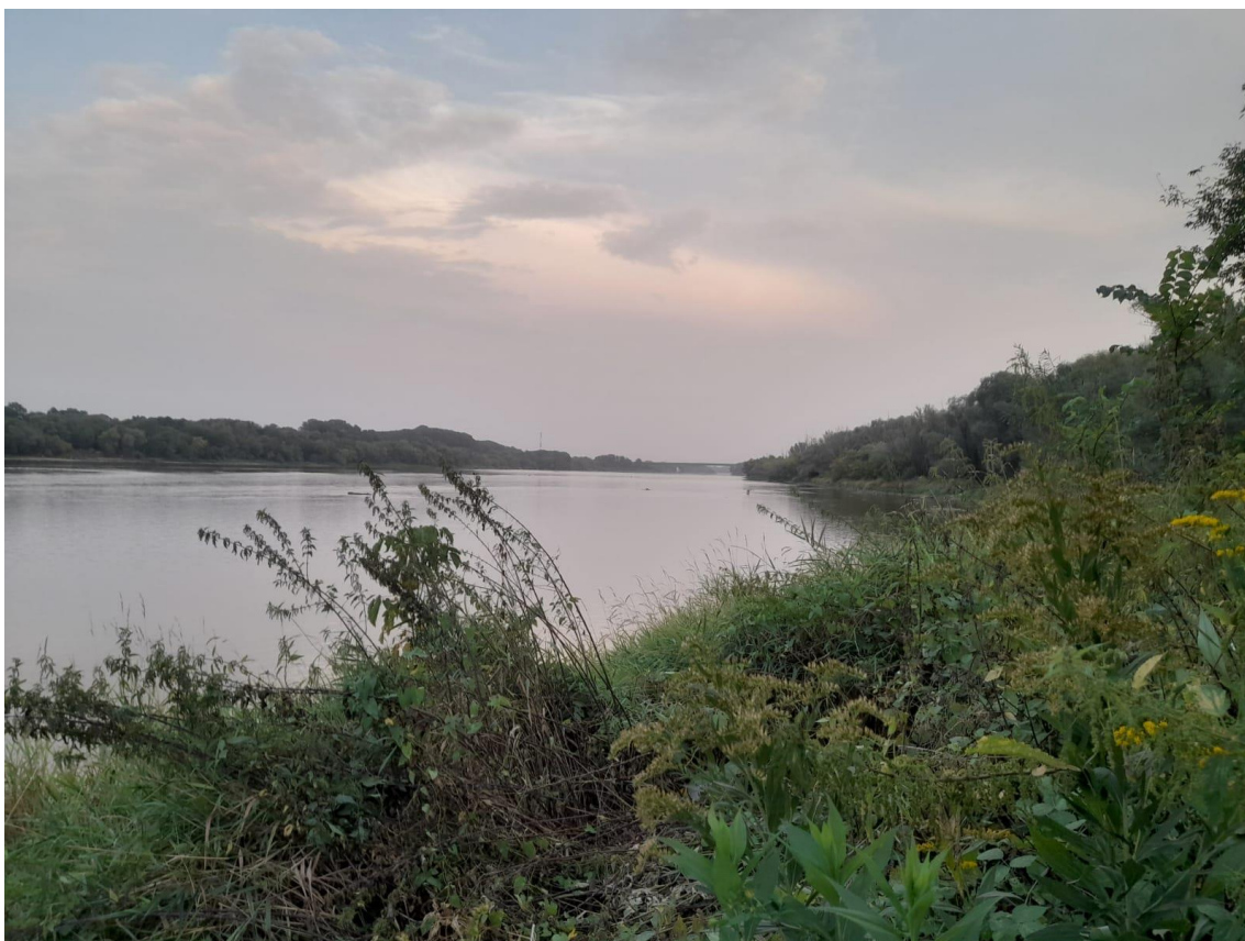
Wisła w Warszawie, sierpień 2022 r.