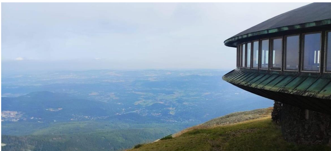
Widoki ze Śnieżki, sierpień 2022 r.