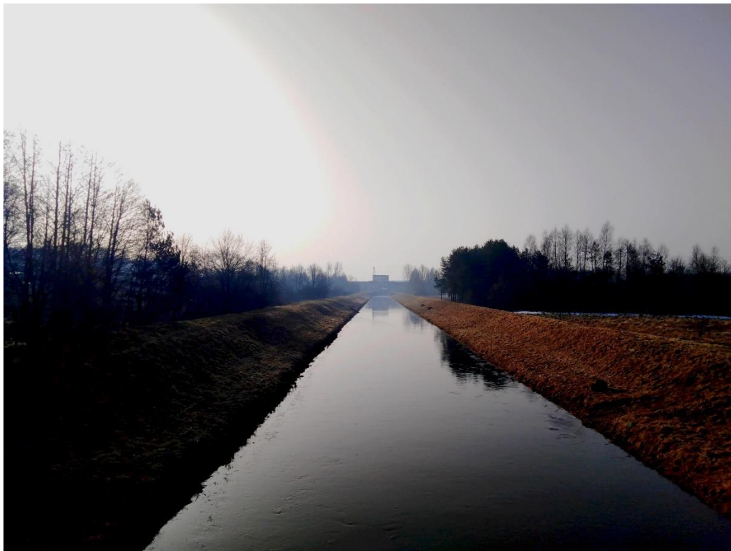
Stacja hydrologiczna Poraj, rzeka Warta, 25.02.2021 r.

Kraków 6°C Kielce 5°C Rzeszów 5°C Zakopane 4°C