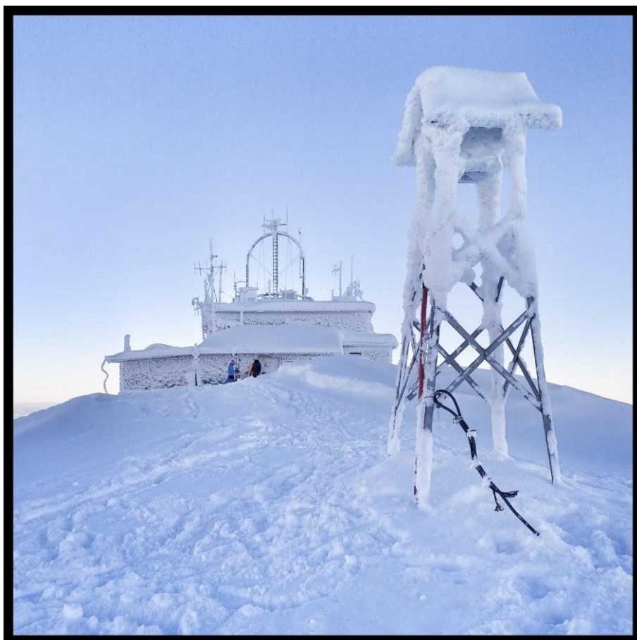
WOM na Kasprowym Wierchu, 28.01.2021 r.

Noc z poniedziałku na wtorek także z niskimi, mroźnymi wartościami temperatury: na wschodzie około -15^{\circ}\text{C} , w centrum od -8^{\circ}\text{C} do -6^{\circ}\text{C} , najcieplej nad morzem -3^{\circ}\text{C} .