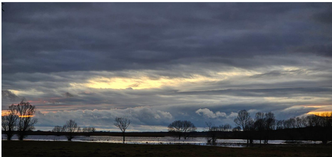
Rozlewiska Narwi na Podlasiu, 17.02.2024 r.

W piątek, sobotę i niedzielę okresami opady deszczu, w rejonie Zatoki Gdańskiej i na Podhalu także deszczu ze śniegiem. Temperatura maksymalna od 4°C na północy do 13°C na południowym wschodzie. Wiatr słaby i umiarkowany, okresami dość silny i porywisty, w piątek w rejonach podgórskich Karpat porywy do 70 km/h, na ogół z kierunków południowych.