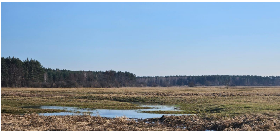
Mazowsze, 16.02.2024 r.

Pogoda w tym tygodniu to kontynuacja aury z poprzednich dni. Dziś przez Polskę przemieszczać się będzie front atmosferyczny, przynosząc opady deszczu. Z zachodu napłynie do nas powietrze polarne morskie – początkowo nieco chłodniejsze, w drugiej połowie tygodnia cieplejsze.