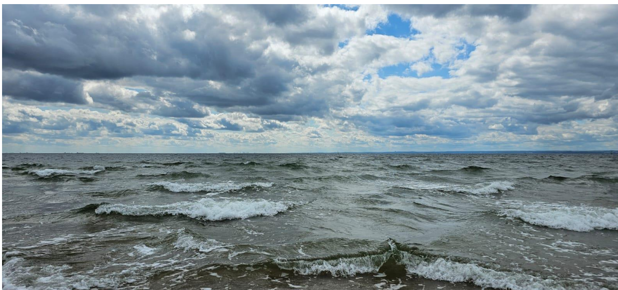
Bałtyk, Fot. Grzegorz Walijewski | IMGW-PIB